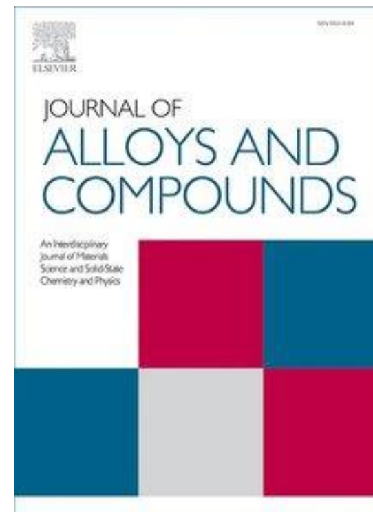
Journal of Alloys and Compounds